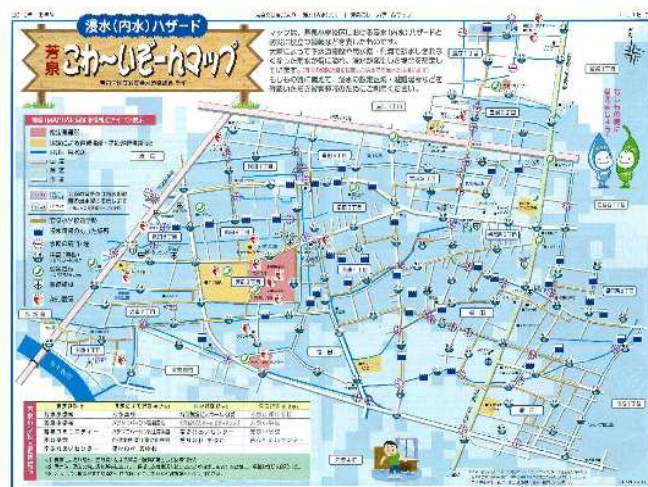
【浸水(内水)ハザード芳泉こわいぞ～んマップ】

安全な地域づくりに繋げていきたいと考えています。こわいぞ～んマップは、浸水（内水）ハザード版も作成し全戸配布しました。海拔表示避難所等を盛り込み、カラーで分かりやすい地図となっています。