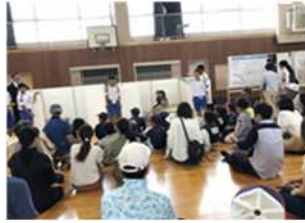
【中学生ボランティアの活躍】

防災訓練当日、中学生ボランティアブースでは中学校PTA役員にサポートにつき“避難時におけるトイレの大切さ”について提案しました。参加者からは、「作り方についてのレクチャーだけでなく、いざというときの心構えもできた」という声も届きました。中学生に勉強してもらったことを、地域活動の中で活かすことは大きな影響を与えることができます。