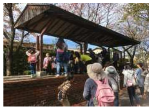
【ウォーキング大会】