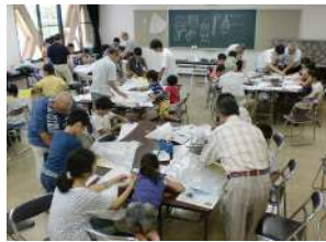
【読み聞かせ講座風景】