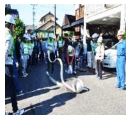
〈平成 30 年みどり団地第 7 回ふれあい防災訓〉

・令和 2 年 4 月東睦学区「単位町内会自主防災会」として、みどり団地・中丁場等 10 班が自主防災会を立ち上げ毎月定例会・講習会を行って防災意識を高めています。