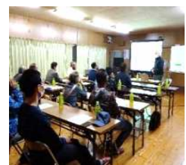
〈令和 3 年中丁場町内会防災講習〉