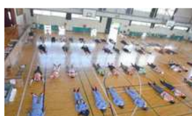
〈居住スペースの確認〉