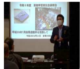
〈飯田校長先生のご講演〉