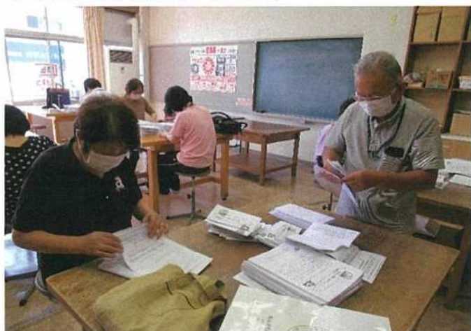
アンケート用紙の封詰め作業の風景

アンケート用紙の封詰め作業は、全戸対象のため地域の有志の方と保健福祉分野の関係機関が協力して行いました。「みんなわいわい作業するのは、楽しいね」「少しでも多くの方がアンケートに協力してくれたら嬉しいね」「自分たちのアンケートが形になるのは嬉しいね」など、皆さん自由にお話ししながら作業を行いました。