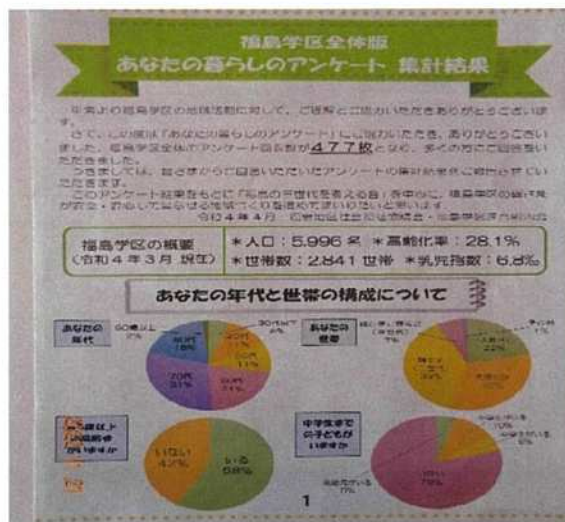
「あなたの暮らしのアンケート」集計結果

福島の三世代を考える会の3役が、連合町内会会長会と連携を図りながら進めた結果、地域に住む皆さんが地域をどのように思っているのかを知ることができたことが、大きな成果でした。