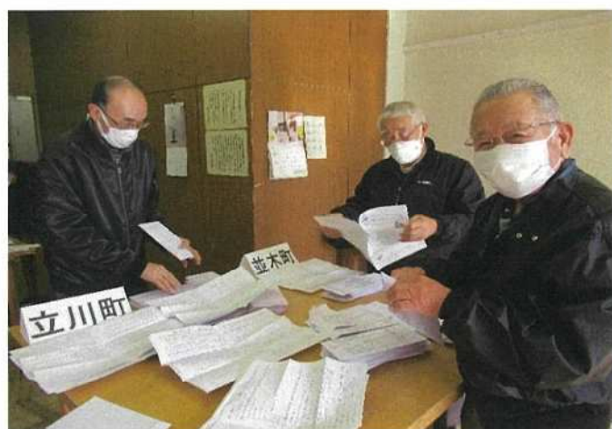
アンケート集計作業の風景

令和3年10月、アンケート用紙は単位町内会長を通じて、全戸に配布しました。同年12月、アンケートの回収と集計作業に着手しました。