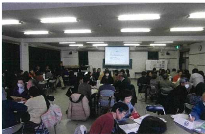
コロナ前のワークショップの風景

福島学区では、平成29年度から認知症や防災をはじめ、地域の支え合いについて、地域住民の皆さんと関係機関で話し合うワークショップを継続して開催しておりました。