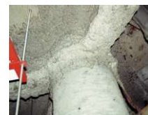
吹付けアスベスト (鉄骨材の耐火被覆)

建築基準法において規制対象とする吹付石綿等が施工されているおそれのある建築物に対しては、地方公共団体が調査および除去等の費用の一部を補助している場合があるので、お近くの地方公共団体にご相談ください。