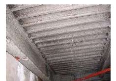
アスベスト含有吹付け ロックウール (鉄骨材の耐火被覆)