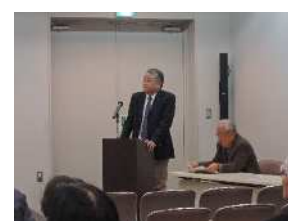
【内山下・深柢合同防災勉強会】