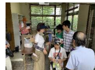
【深柢ガーデンでの避難訓練】