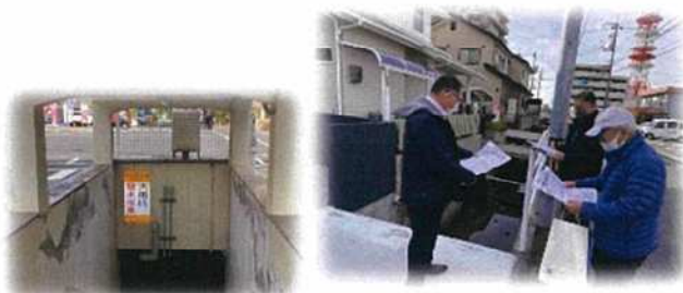
【危険箇所確認の様子】

マップの更新は学区自主防災会、連合町内会、大元小学校PTAと協働で行っていますが、内容を見直し、新たに調査する中で、改めて地域の危険箇所を知り、いざという時にどのように対処すればいいかを考える良いきっかけになっています。