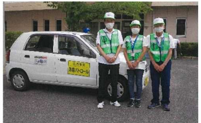
【三門防犯パトロール隊】

平成 29 年 6 月に結成。現在は隊長以下 51 名のメンバーで活動。毎週火曜日、金曜日の午後 4 時から、3 人 1 組で青パトによる通学路、公園を中心とした見回りをしています。少人数やひとりで下校する子どもたちも多いため、不審者や声掛け被害から児童・生徒を守る部隊として活動しています。