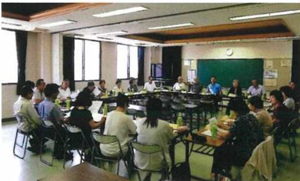
【三門学区ビッグ網会議】

第 1 回ビッグ網会議では、学区の課題として、少子化、高齢化、南海トラフ地震などが挙げられました。平成 30 年 9 月の第 2 回ビッグ網会議では、安心して暮らせるまちづくりを目指して、「思いやり笑顔がひろがる三門学区」という共有スローガンができました。また、課題解決に向けて各町内会長と協力して、現況を「見える化」するための住民アンケートを行うことになりました。配布総数 3,262 世帯、回収総数 1,167 世帯でした。アンケートはすべて各町内会と三門学区ビッグ網の方々、集計ではボランティアの方々にも協力していただきました。