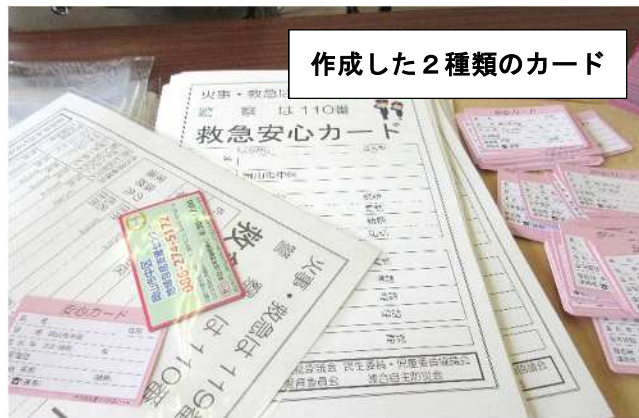
作成した2種類のカード

操南学区安全・安心ネットワークでは、平成25年に「安心カード・救急安心カード」を作成し、学区内の65歳以上の希望者に配布。消防署なども操南学区の救急安心カードについて把握しており、いざという時の家族への連絡等に活用している。このカードは作成から約8年が経過したこともあり、操南支え合いの会では「安心カード・救急安心カード」のリメイクを行った。