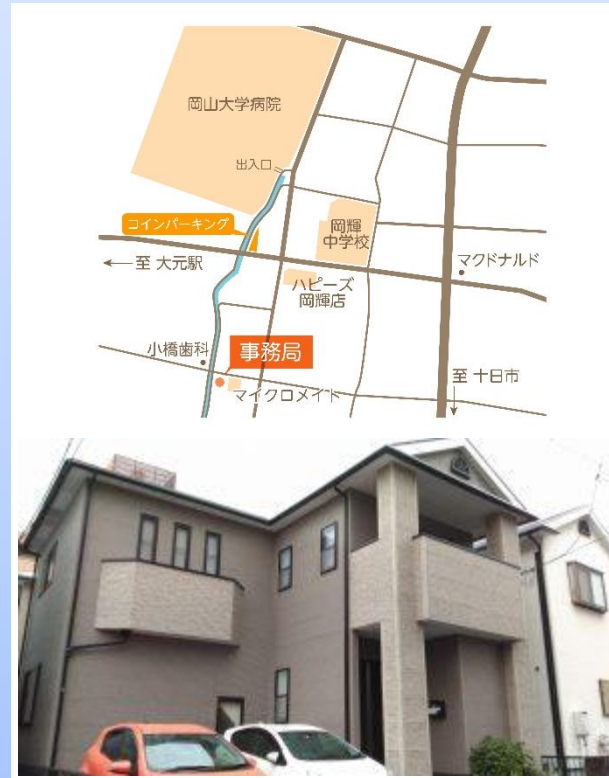
▲ポケットサポート事務局の外観

※交流支援拠点は変更になる場合があります。 下記【ポケットサポート事務局】に記載している 電話・ホームページで予めご確認ください。