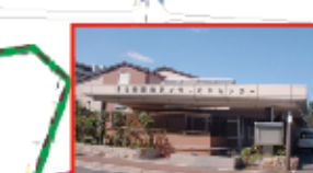
アイサービスセンター