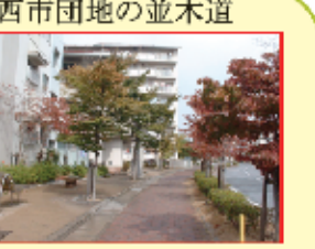
西市団地の並木道

西市団地の歩道は、写真のようになっています。樹木が両側に植えられたり、木道やベンチが置かれたり、工夫が凝らされています。休日の散歩にいい場所です。