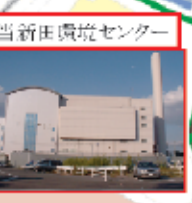
当新田運動センター