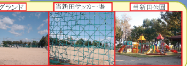
グラウンド 当新田サッカー場 当新田公園

グラウンドでは、しみ、サッカー場では元気な掛け声が遠くまで聞こえ、公園では子供たちが遊具で楽しく遊んでいます。外園は桜やつつじも植えられ、野草や昆虫の宝庫です。照明やトイレも完備され、散歩には最適です。