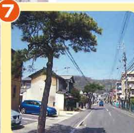
騎兵隊道に残る松並木