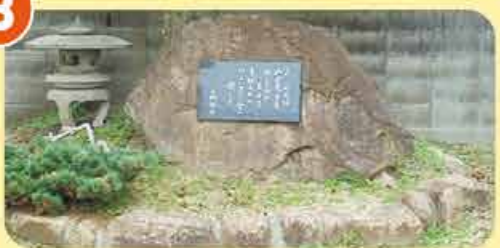
うざん 烏山小学校跡