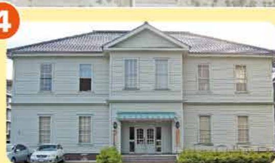
第十七師団司令部 第十七師団・第三十三旅団・岡山聯隊 区司令部が置かれていた。