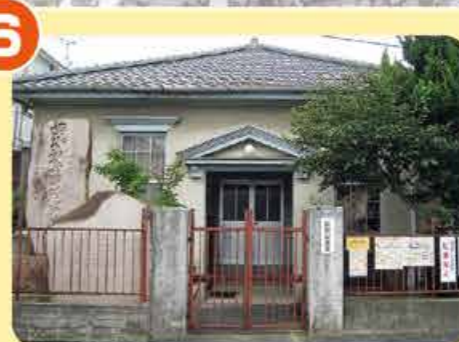
津島新野公会堂 騎兵第21聯隊将校集会所