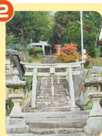
あまつじんじや 天津神社