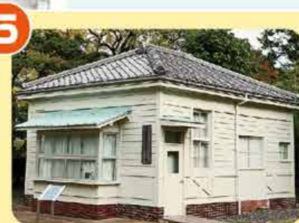
衛兵所 第十七師団司令部、第三十三 旅団司令部の前面に置かれて いた衛兵所。