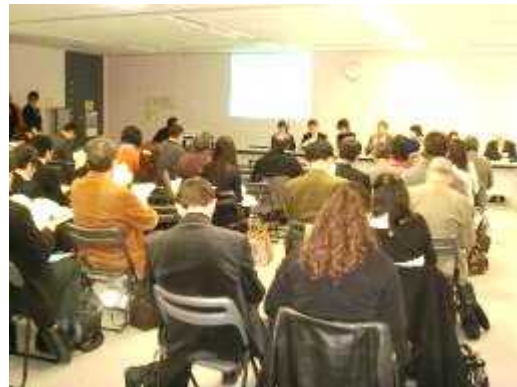
がいこくせきけんみん かいぎ しまつ 外国籍県民かながわ会議を視察