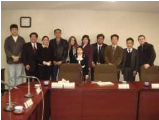
はまつしがいこくじんしむんかいぎ しまつ 浜松市外国人市民会議を視察

かいさいにちじ ねん がつ にち ごご し ぶん 【開催日時】2008年5月11日(日)午後12時30分から ば しょ おかやまこくさいこうりゅう かい こうりゅう 【場 所】岡山国際交流センター 4階 交流サロン ない よう だい きていげん くたいか む どうめん たいおうよてい 【内 容】第1期提言の具体化に向けた当面の対応予定について た ぶんかきょうせいしゃかいすいしん あん 多文化共生社会推進プラン(案)について こんご せつてい 今後のテーマの設定について せんしんとし はまつし かながわけん しまつ ほうこく 先進都市(浜松市・神奈川県)視察の報告について