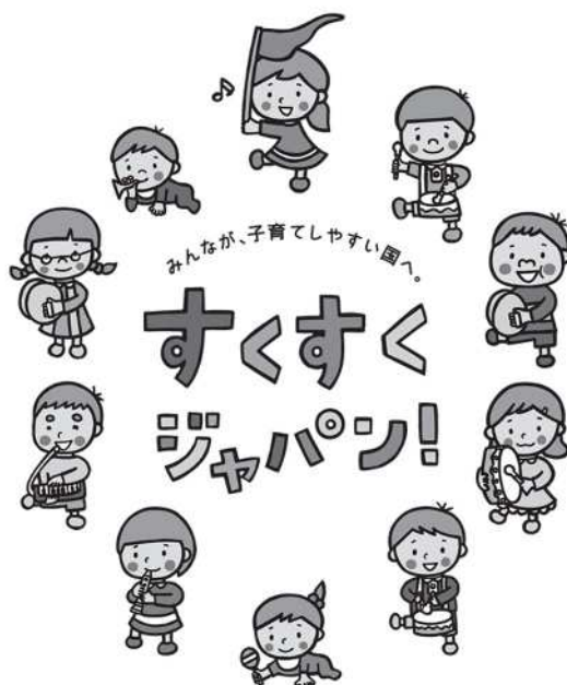
「子ども・子育て支援新制度シンボルマーク」

※「新制度に移行していない」幼稚園等の利用を希望される場合は、直接施設にお問い合わせください。