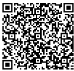
iphone 端末 Terminal iphone

Utilice la aplicación de separación de basura ↓