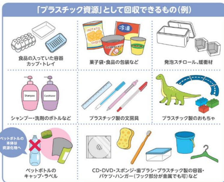
図：回収できるもの(左)と回収できないもの(右)