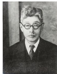
大賀一郎氏

このハスは世界で最も古いハスです。1952年7月、植物学者・大賀一郎が、千葉県検見川で地元の中学生たちと協力して発掘