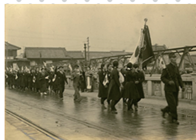
橋の上を日の丸を持って行進する岡山県第一岡山高等女学校の生徒たち(1941年(昭和16)以降)