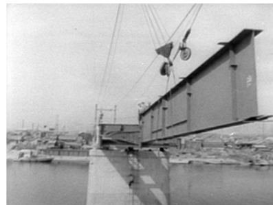
岡山市の桜橋架橋工事風景(動画も展示しします)