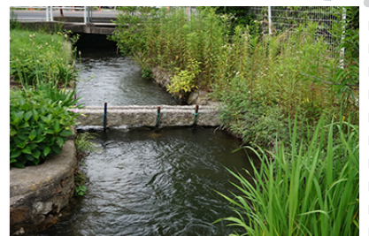
駅から学校への近道

行き方：JR東総社駅から東南へ徒歩5分、JR総社駅から東へ自転車(レンタサイクル)で10分または徒歩25分