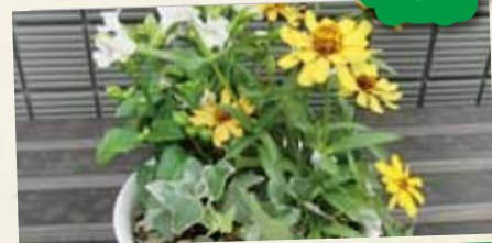
緑のポットを作ろう