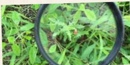
カモフラージュ& マイクロハイク