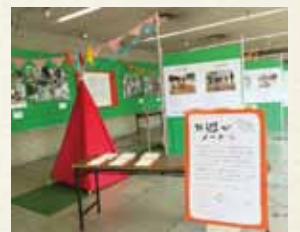
※過去の展示の様子

子どもの外遊びに役立つ情報、外遊びで作ったモノなどを展示します。それから、遊びの体験コーナーもぜひ、お気軽にご来場ください。観覧、体験 無料。