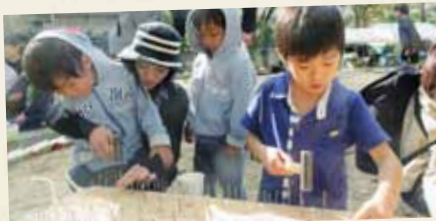
コリントゲームを 作ってあそぼう