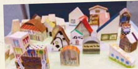
木片を使ってあそぼう