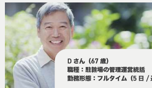
Dさん (67歳) 職種：駐車場の管理運営統括 勤務形態：フルタイム (5日/週)

就職を志したのは、生きがいのためです。退職後は、前職を頑張ってきたのでゆっくり自分の時間を楽しもうと思っていました。しかし、人との関わりがなくなり、社会とのつながりがなくなったように感じ、なにかできないかと思い始めました。会社に入ってから、同僚と会話するなかでお互いの考え方の違いがわかり、刺激を受けています。