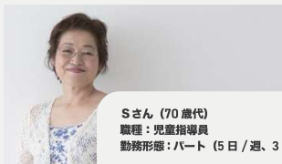
Sさん (70歳代) 職種：児童指導員 勤務形態：パート (5日/週、3時間)

退職後、時間を有効に使いたい、以前から関心のある仕事をしたいと思ったことが就職のきっかけでした。本事業の支援を受けて、就職後も困ったことがあれば相談員に気軽に相談できるので安心しました。また、以前働いていた時に比べて、今はいたわりの言葉がスムーズに出るようになり、友だちから「最近優しくなったね」と言われます。自分自身の変化や成長を感じられて嬉しです。