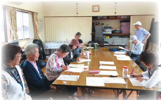
あんしんカプセル更新の様子

また、平成31年度より「南輝学区第2次地域福祉活動計画」を策定し、高齢者支援をはじめ、防災や広報啓発活動、次世代の育成について、南輝ケア会議で活発に取り組んでいます。