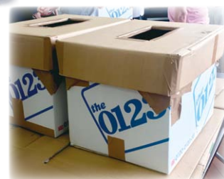
南輝ケア会議全体会