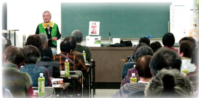
いきいき活動交流会