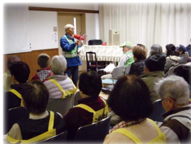
(避難の在り方について説明)