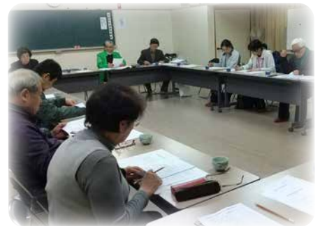
支え合い推進会議