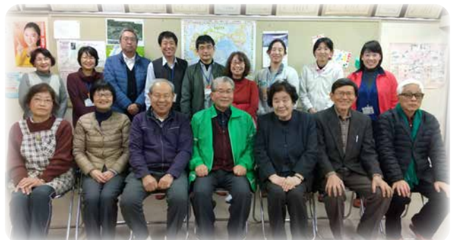
「旭竜学区支え合い推進協議会のみなさん」