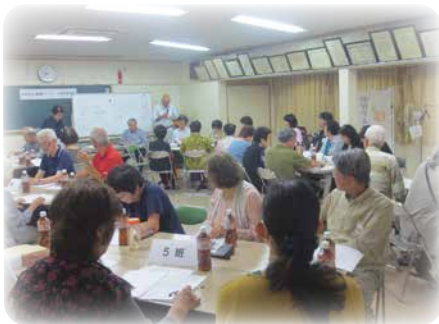
アンケート結果報告会

現在は、アンケートで要望のあったゴミ出しや話し相手等の生活支援サービスの創出に向けて、メンバーで定期的に集まり話し合っています。