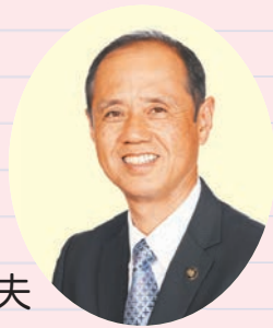
岡山市長 大森 雅夫

岡山市は、恵まれた自然環境や西日本の交通結節点に位置する地理的優位性、医療・福祉・教育をはじめとした都市機能の集積等を生かし、政令指定都市、そして中四国の拠点都市として、市民の皆様とともに「未来へ躍動する桃太郎のまち岡山」をめざして取り組んでいるところです。