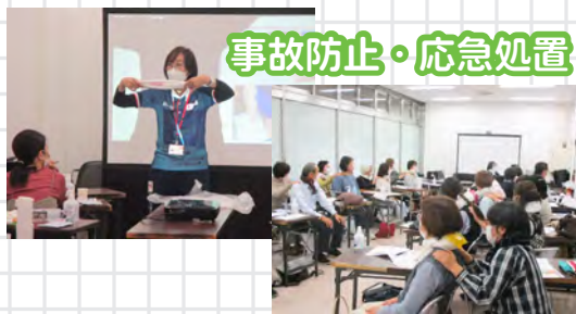
事故防止・応急処置