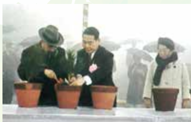
第18回 全国植樹祭の様子▶

国土緑化運動の中心的な行事で、天皇皇后両陛下のご臨席のもと、式典行事や記念植樹等を通じて、国民の森林に対する愛情を培うことを目的に毎年春に開催されています。岡山県では、昭和42年に金山山頂(岡山市)にて第18回大会を開催しており、令和6年には57年ぶり2回目となる第74回大会を岡山市内で開催します。