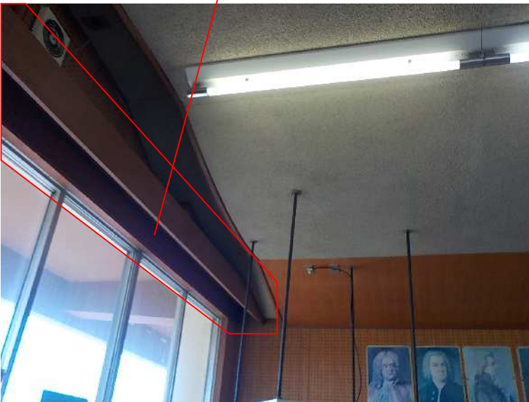
現況写真2 (NO SCALE)