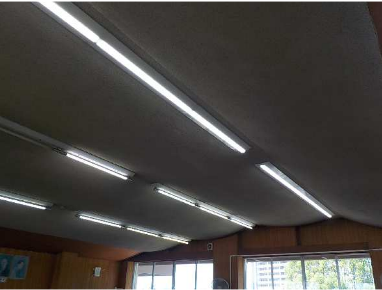
現況写真1 (NO SCALE)