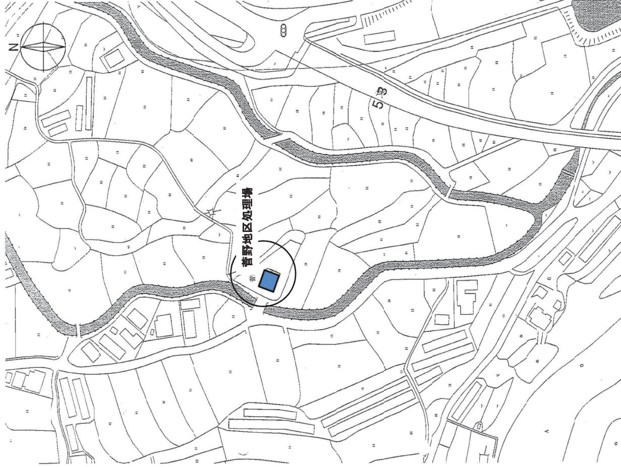
【菅野地区処理場 位置図】