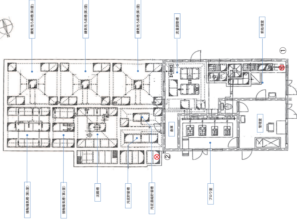
(処理場 一般平面図)