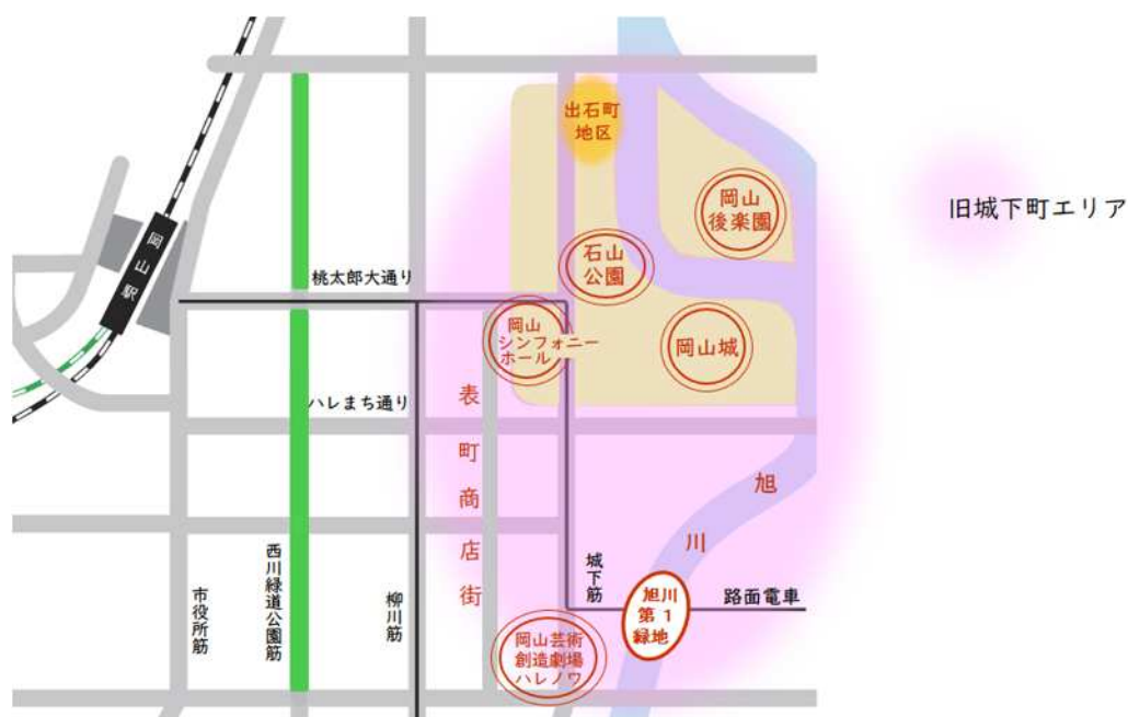
岡山市中心市街地イメージ図

これより、旭川かわまちづくりの取組の一環として、岡山城・岡山後楽園や岡山芸術創造劇場ハレノワが位置する旧城下町エリアのさらなる賑わい創出と回遊性の向上を図るため、中区西中島町の旭川第1緑地において、賑わい創出に取り組む社会実験（トライアル・サウンディング）の事業者を募集する。