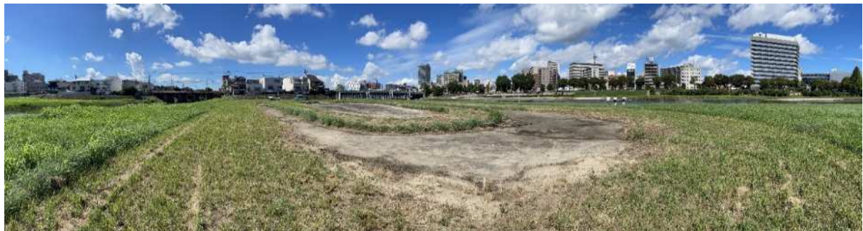
現地写真（令和5年8月撮影）