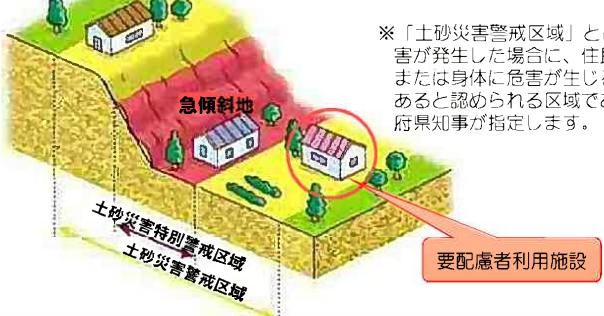
【土砂災害警戒区域の指定】

※「土砂災害警戒区域」とは、土砂災害が発生した場合に、住民等の生命または身体に危害が生じるおそれがあると認められる区域であり、都道府県知事が指定します。