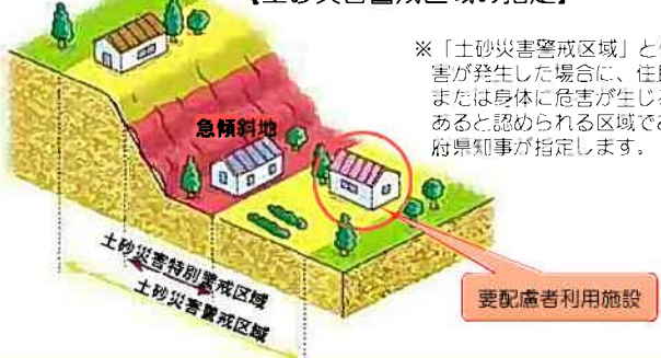
【土砂災害警戒区域の指定】

※「土砂災害警戒区域」とは、土砂災害が発生した場合に、住民等の生命または身体に危害が生じるおそれがあると認められる区域であり、都道府県知事が指定します。