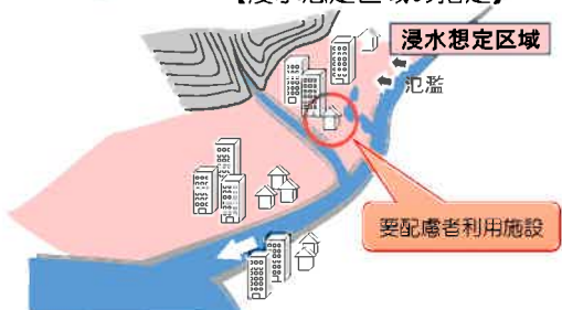
【浸水想定区域の指定】

※「洪水浸水想定区域」とは、河川が氾濫した場合に浸水が想定される区域であり、河川等管理者である国または都道府県が指定します。