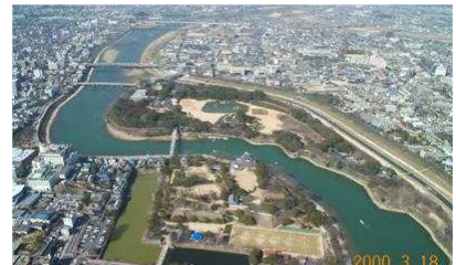
水の骨格をなす旭川の清流