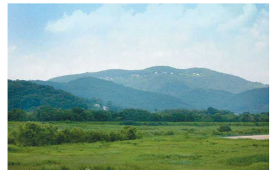
緑の骨格をなす金山、笠井山

吉井川・旭川・笹ヶ瀬川の3大河川を岡山市の景観の骨格を形成する自然の軸として位置づけ、平坦地の景観のアクセントとして広大な水面や魅力ある水辺空間を守り活用していきます。