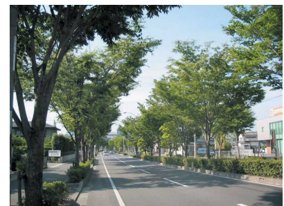
軸となる幹線道路