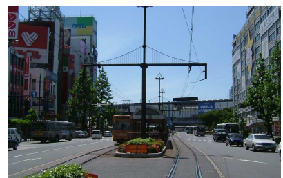
核となる都心の駅前地区

多くの人々が利用し、岡山市の都市活動の軸となる放射状・環状の幹線道路の沿道において、それぞれの場所に応じた個性と魅力ある沿道景観の形成を進めていきます。