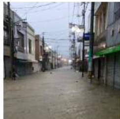
浸水により街路灯が故障