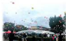
復興イベント・祭り

平成30年7月豪雨により被害を受けた商店街等（下図の自治体に所在する商店街）が行う、にぎわい創出のためのイベント等の事業に対して補助を行います。