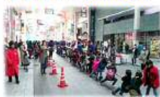
子ども向けのアクティビティ