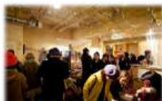
空き店舗を活用した チャレンジショップ型のバザー