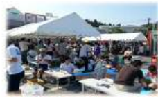
仮設住宅生活者向け 移動販売