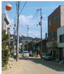
浸水によるカラー舗装損傷

平成30年7月豪雨により被害を受けた商店街の共同施設の改修等に要する費用を支援します。