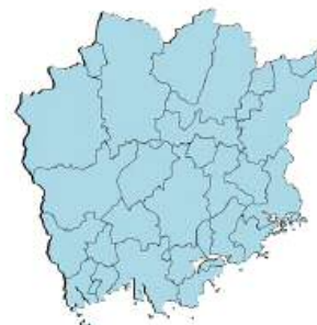
※岡山県内全域の商店街が対象