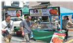
matcha・グルメイベント