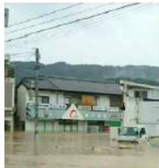
河川等の氾濫により 商店街に浸水