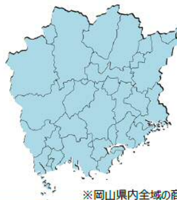
※岡山県内全域の商店街が対象