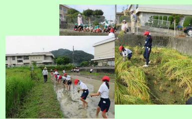
学習田(遊休農地の有効活用)