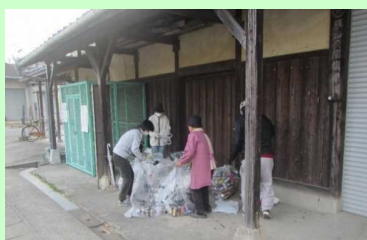
クリーン作戦、美化活動