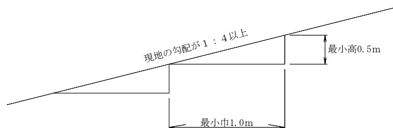
図2-1 盛土基礎地盤の段切