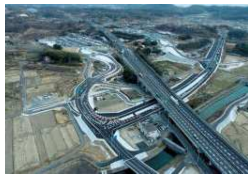
■吉備スマートIC 航空写真

さらに、令和8年2月1日には吉備スマートICの2.4時間化・大型車対応と総社・一宮バイパス(北区一宮山崎～今岡)が同時開通し、市内から高速道路へのアクセスが強化されました。