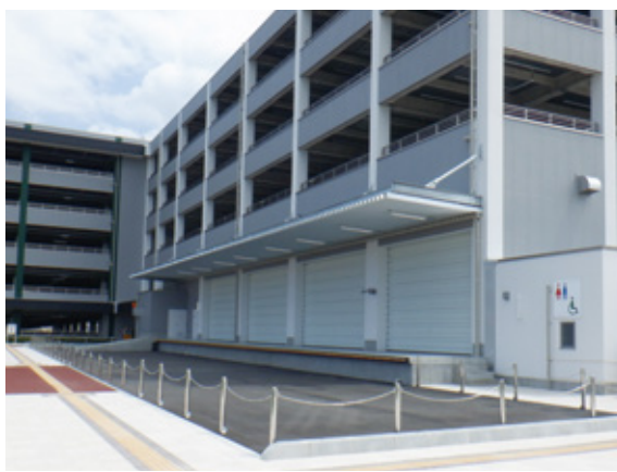
岡山ドーム東側に整備されている集中備蓄倉庫

Q 南海トラフ地震などの災害に備え、令和3年9月に集中備蓄倉庫を岡山ドーム東側に整備した。4年度に南区役所敷地内へ建築予定の集中備蓄倉庫の概要、また、中区や東区への整備は。