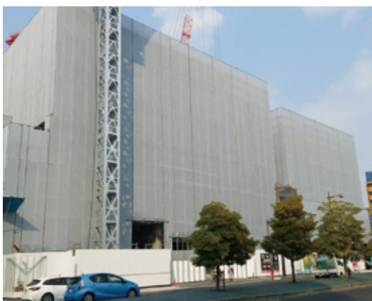
整備が進む岡山芸術創造劇場ハレノワ

芸術創造劇場は4年7月から利用受付が始まる予定であるが、付属設備使用料の検討状況は。利用案内はいづから開始できるのか。