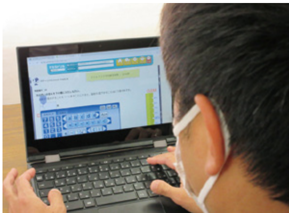
学習ソフトを使った学習支援(イメージ)

▲ 不登校児童生徒が希望する場合は端末の持ち帰りができるようにし、オンラインで学習相談を行ったり学習ソフトを使った学習支援を行っている。今後も、不登校児童生徒が担任や学級の児童生徒等とつながり、人との関わりを持てる機会を生み出すツールとして端末の活用を進め、その一環として学習支援にも生かしたい。