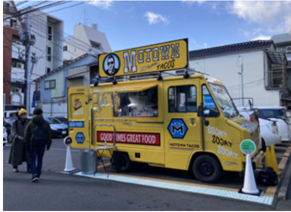
街なかの駐車場に出店するキッチンカー

検討した上で4年度も実施し、将来的な民間主体での事業展開の可能性について検討していきたい。