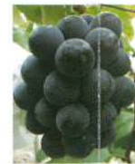
◆ オーロラブラック