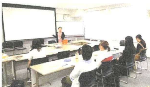
▲新規ボランティア説明会および初回研修風景