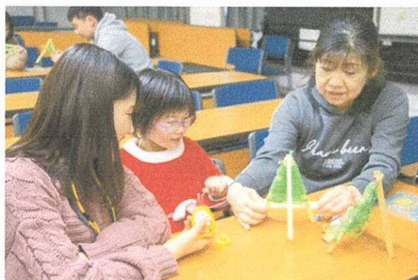
▲毛糸を使ったクリスマスツリーづくりの様子