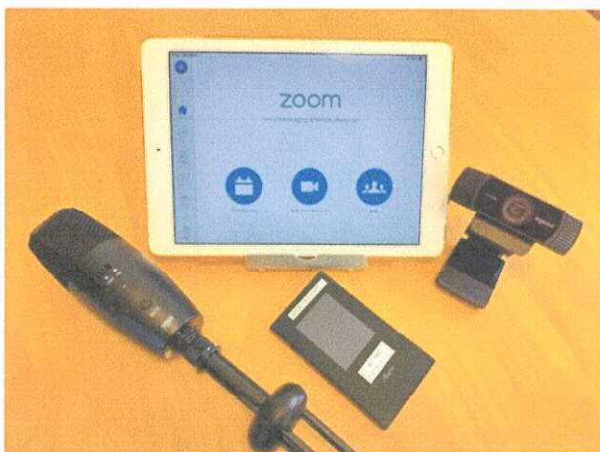
▲双方向WEB学習支援用ICT機器