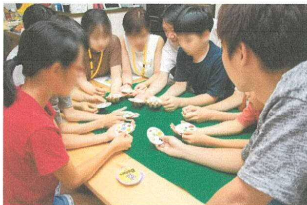
岡山市小児慢性特定疾病児童等相互交流支援業務