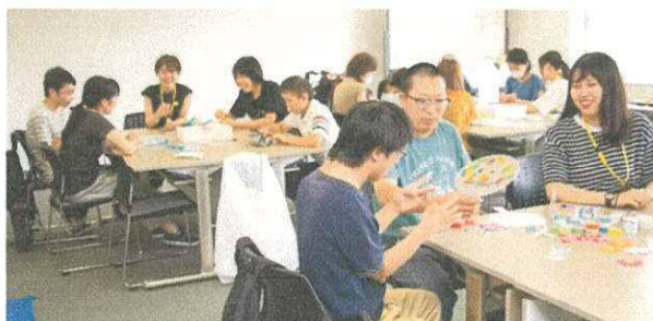
▲夏祭りの様子（オリジナルうちわづくり）