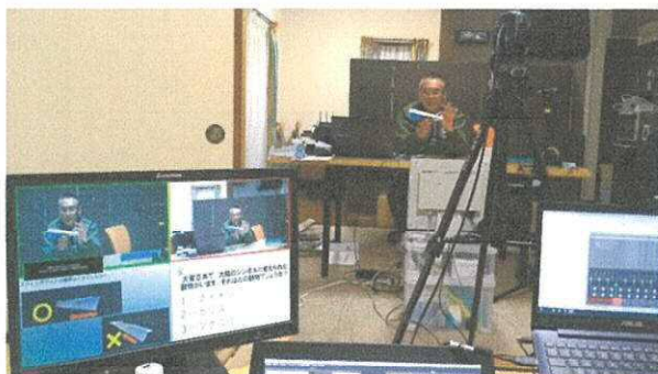
▲宇宙クイズ（事務所からYoutube配信する様子）