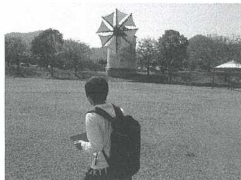
10月に行った岡山サウスヴィレッジでの美術活動の様子です。