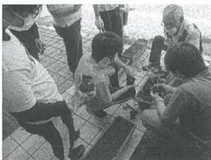
週に1度行っている農業体験の様子です。