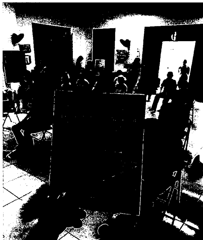
(4月高齢者のコミュニティ訪問)