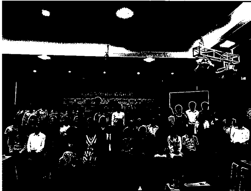
(9月 WHO ワークショップ)