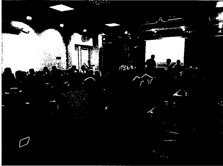
(7月介護予防セミナー)