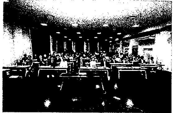
「災害支援ネットワークおかやま」設立総会の様子

皆様から「あってよかった」「助かった」と言われる支援組織となるために、これからも質の高い連携・協働を心がけて各事業を推進してまいります。