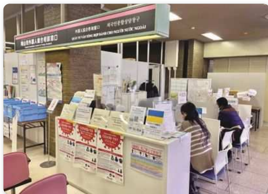
岡山市外国人総合相談窓口（市役所本庁舎1階）

市役所での手続きや生活の困りごとがあったり、どこに相談すればよいか分からないという外国人市民の方の相談を無料で受け付けています。英語、中国語、ベトナム語、韓国語の相談員による対応に加え、タブレット端末による多言語テレビ通訳で16言語での対応が可能です。