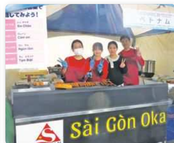
ワールド屋台の様子