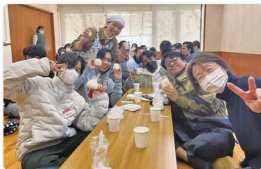
おにぎり作り体験