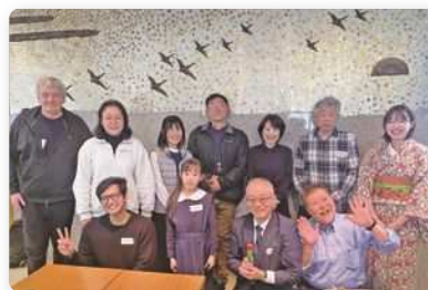
2月22日「外国語スピーチ交流会」