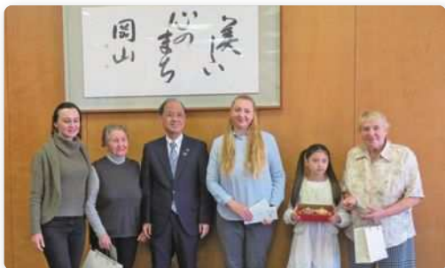
2月19日 募金贈呈及び市長との懇談会

ロシアによるウクライナ侵攻から逃れ、ウクライナから岡山市へ避難された方を直接支援するため、市民の皆様から募金していただき、協議会を通して避難民の皆様へ贈呈させていただきました。皆様からの温かいご支援ありがとうございます。