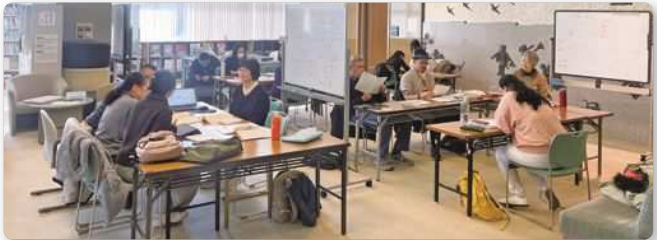
西川日本語教室の様子