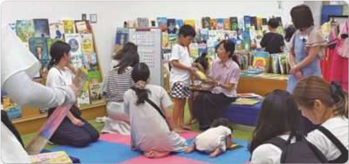
7月27日 韓国語でえほんのじかん

中央図書館と幸町図書館との共催で、英語で2回、韓国語で2回、中国語で1回、ベトナム語で1回の計6回開催しました。講師が絵本を読むほか、その言語での歌や踊りも披露し、たくさんの親子の参加者が楽しんでいました。