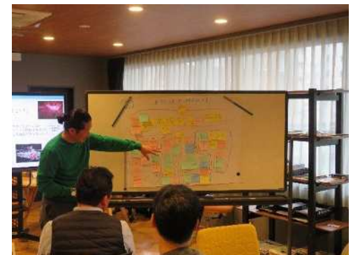
③各グループの代表が全体発表を行う