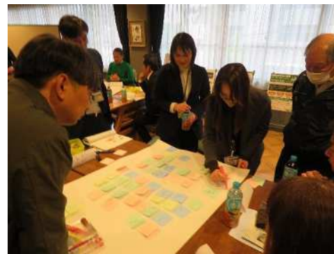
②グループごとに意見を模造紙にまとめる