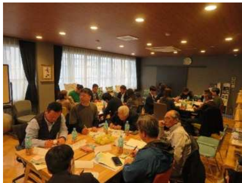
①テーマごとに意見を付箋紙に書き出す