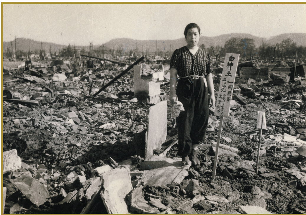
「疎開先を知らせる札とともに自宅の焼け跡に立つ女性」(場所不明) 1945年