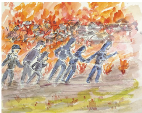
「人絹道路を南福島方面に逃げる人々」 山本英子作 2018年

岡山市の場合は1945年6月29日に大規模な空襲を受け、当時の市街地の63%を焼失し、少なくとも1737人*の死者が出ました。(*2000人をこえるという説もあります。)