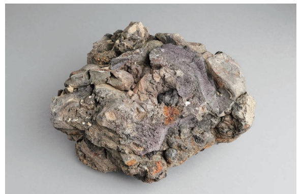
岡山城改修時に出土した、焼け溶けた瓦の塊