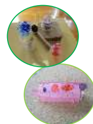
↑昨年度の作品です