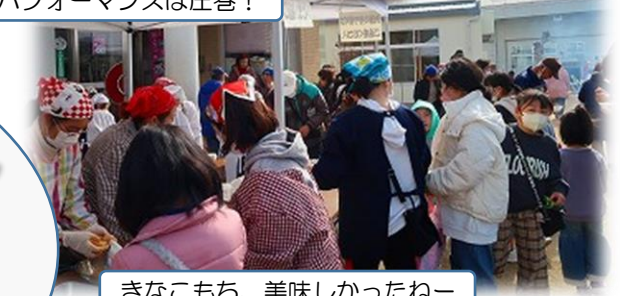
きなこもち、美味しかったねー