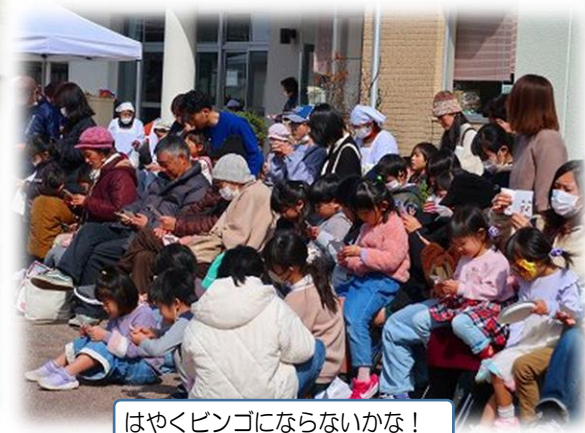
はやくビンゴにならないかな！