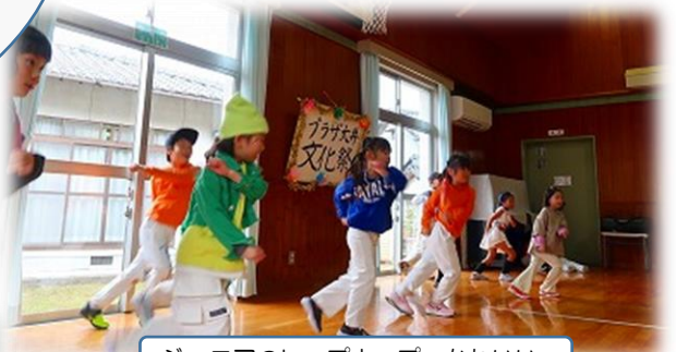
ジュニアのヒップホップ、かわいいー