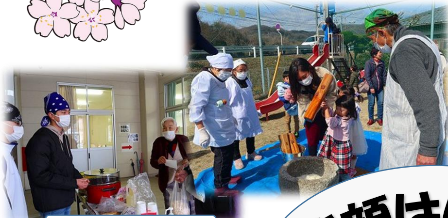
ポップコーンいかがですかー