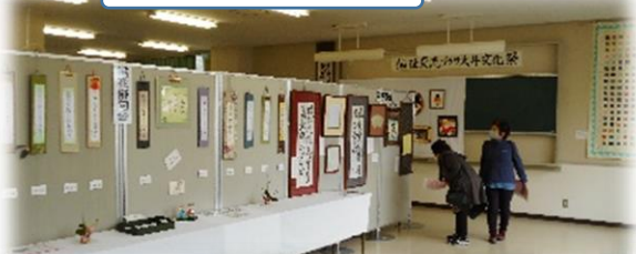
見応え十分の力作ぞろい