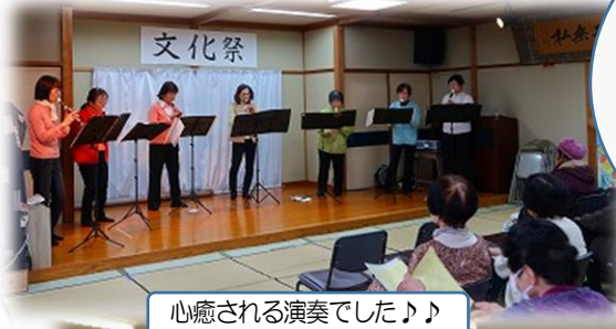
心癒される演奏でした♪♪