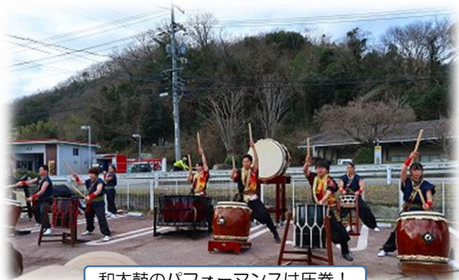
和太鼓のパフォーマンスは圧巻！