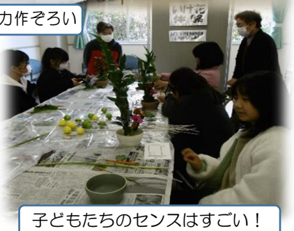
子どもたちのセンスはすごい！