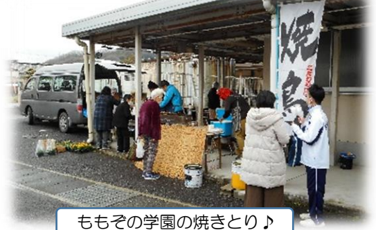
ももその学園の焼きとり♪