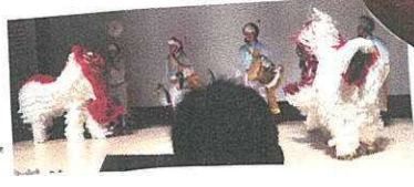
BTSのライブに出てきた催し物を見た

国ごとに分かれて楽器体験やまんじゅうを作った。 この日は特に国同士の交流ができて、親睦も深まった。