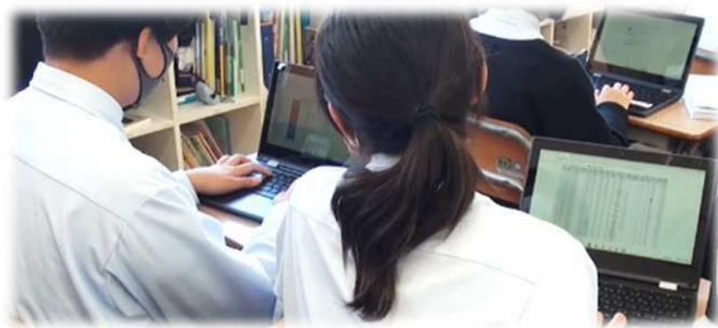
教育課題別研究 授業の様子