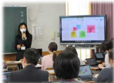
教育課題別研究 校内研修の様子