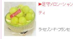
▶足守メロン・シャンティ