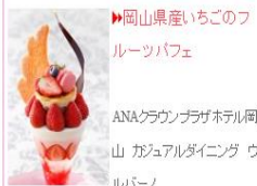
▶岡山県産いちごのフルーツパフェ