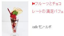
▶フルーツとチョコレートの満足パフェ