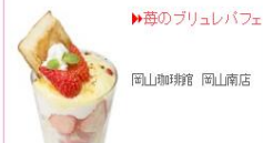
▶苺のブリュレパフェ