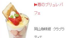
▶苺のブリュレパフェ