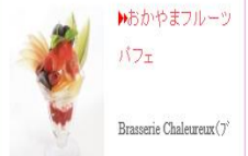
▶おかやまフルーツパフェ