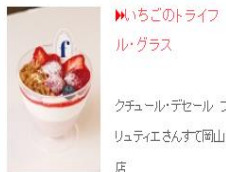
▶いちごのトライフル・グラス