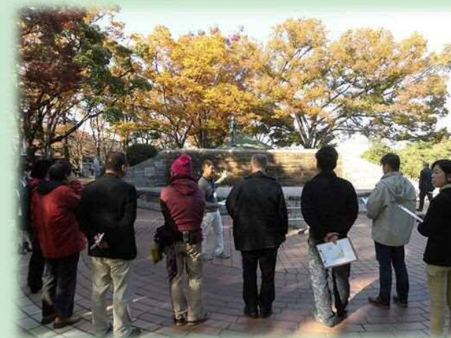
第1回ワークショップでの現地点検の様子

参加された皆様のおかげで楽しい雰囲気でのワークショップができました。皆様に感謝すると共に、いただいた意見を基に、関係機関等と調整しながら、公園設計、公園づくりにつなげていきます。