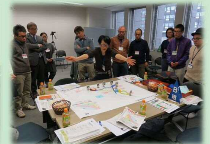
第3回ワークショップでの施設配置計画案発表の様子