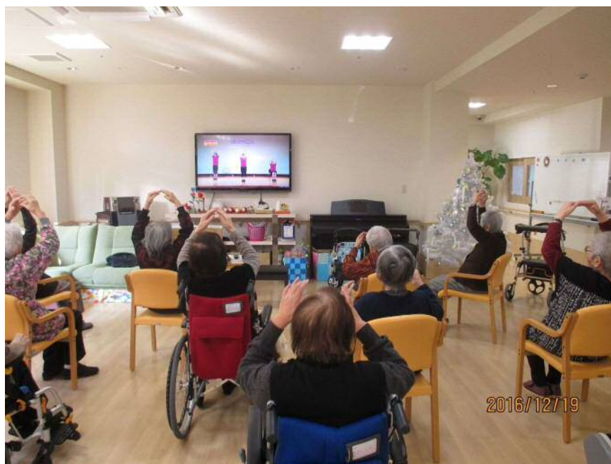
朝の市民体操の様子