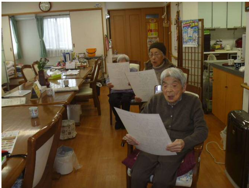
活力朝礼にて、ご利用者様と一緒に社歌を歌う1コマ