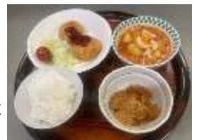
【昼食メニューの例】