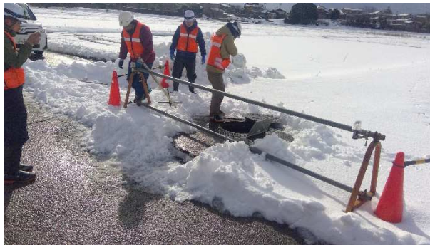
小松市における下水道管きよの調査状況