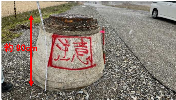
地震によるマンホールの隆起