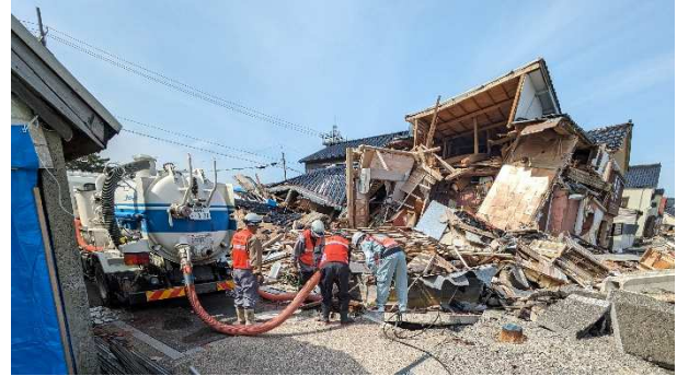
輪島市における下水道管きよの調査状況